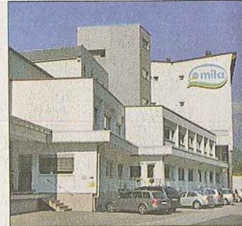
Das Mila-Gebäude in Bozen.