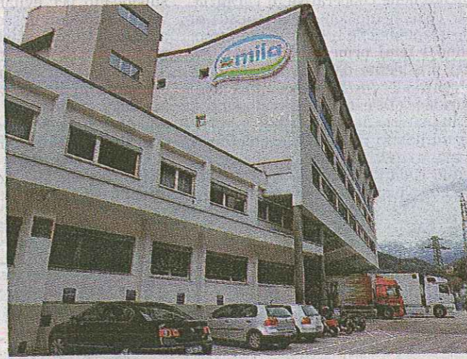
La storica sede della Mila a Campiglio si prepara a cambiare volto